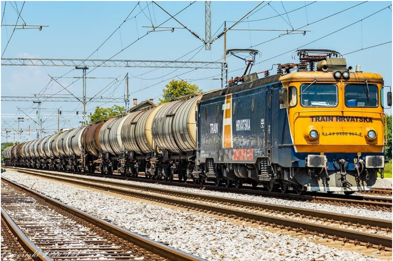
Autor: Ivan Tuk

Autor: Iva Slavica Ilić , mag. ing. traff