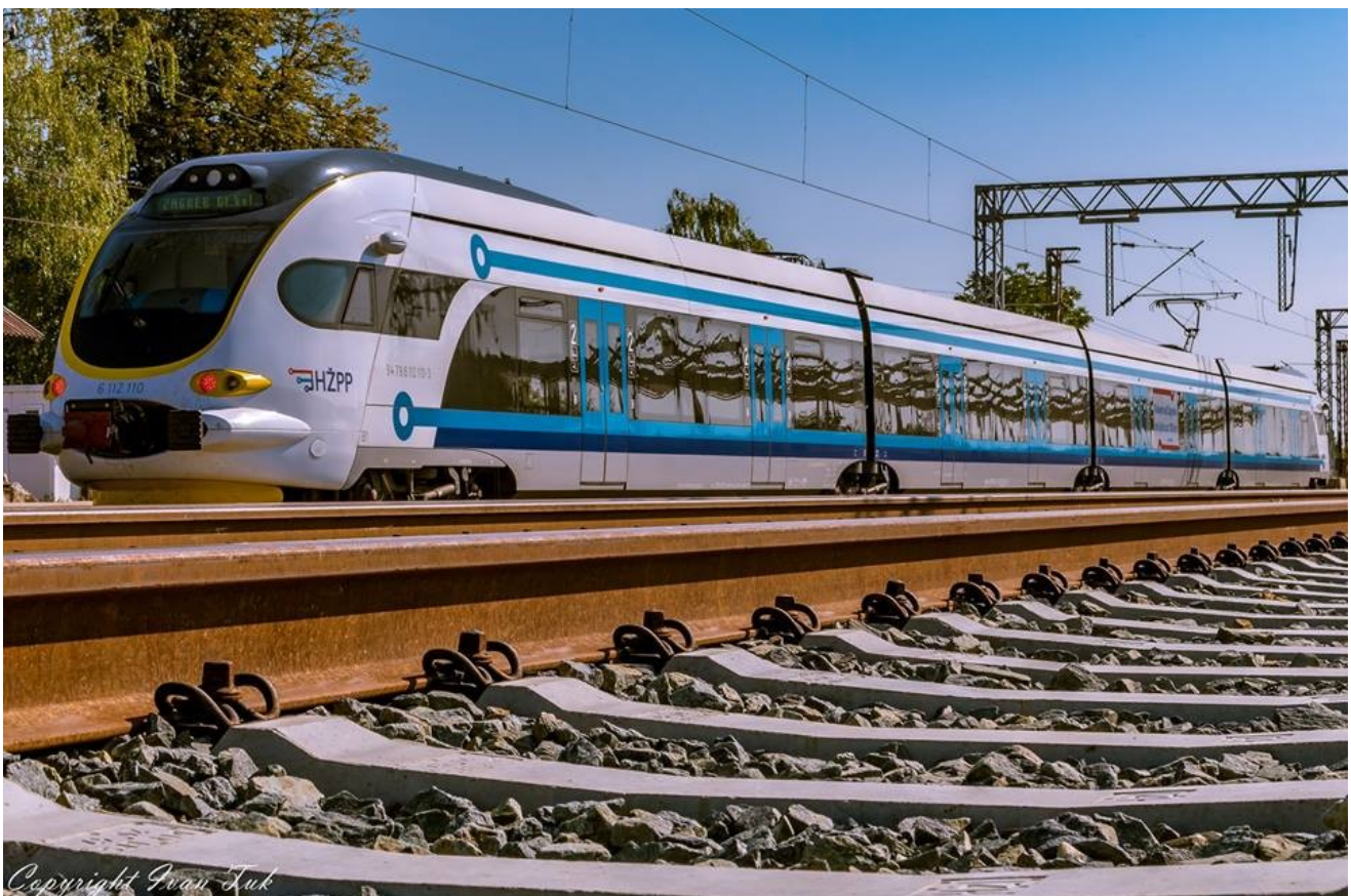
Autor: Ivan Tuk

matrati u kontekstu mreže koja tvori jedinstvenu tehničko-tehnološku cjelinu, koja zahtjeva tehničko-tehnološku uniformnost na cijeloj duljini određenog koridora koji implicira tehnološku efikasnost jer sadrži usklađenost tehnološkog procesa rada u realizaciji više razine usluga u putničkom i teretnom prijevozu. Putnički i teretni željeznički promet nije nestao, nego se samo realizirao kroz tehnološke procese drugih prometnih podsustava. Infrastrukturnu mrežu potrebno je u naprijed podijeliti na definirane tehničko-tehnološke i ekonomske module kako bi se na temelju predviđenih i realiziranih ulaganja u željezničku infrastrukturu, u što kraćem roku postigli kapaciteti mreže ciljane učinkovitosti. Tako se prometni čvorovi promatraju