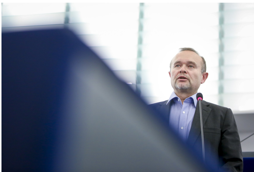
Zastupnik u Europskom parlamentu Davor Škrlec

Europski socijalni fond je najstariji financijski instrument EU-a osnovan s ciljem smanjivanja razlika u životnom standardu država članica. Novčana sredstva iz fonda namijenjena su zapošljavanju i mobilnosti radne snage, promicanju socijalne uključenosti te borbi protiv siromaštva. Zbog pojednostavljenja, veće fleksibilnosti i administrativnog rasterećenja, naglašena je potreba stvaranja novog Europskog socijalnog fonda+, uz povećanje njegova financiranja unutar višegodišnjeg proračunskog okvira (2021.-2027.). ESF+ je tako rezultat spajanja postojećeg fonda s Inicijativom za zapošljavanje mladih, Fondom europske pomoći za najpotrebitije, Programom Europske Unije za zapošljavanje i socijalne inicijative te Europskim programom za zdravlje. S tim u vezi, predviđen je niz mjera kojima će ovako transformirani fond nastaviti djelovati na području obrazovanja te promicanja socijalne uključenosti i zapošljavanja. Prvenstveno, poticat će se projekti otvaranja novih radnih mjesta za mlade i pomoći za beskućnike. Tome u prilog ide i odluka da minimalno tri posto novčanih sredstva iz fonda bude osigurano za najugroženije. Uz to, naglašena je i važnost borbe protiv diskriminacije te promicanje socioekonomske integracije mar-